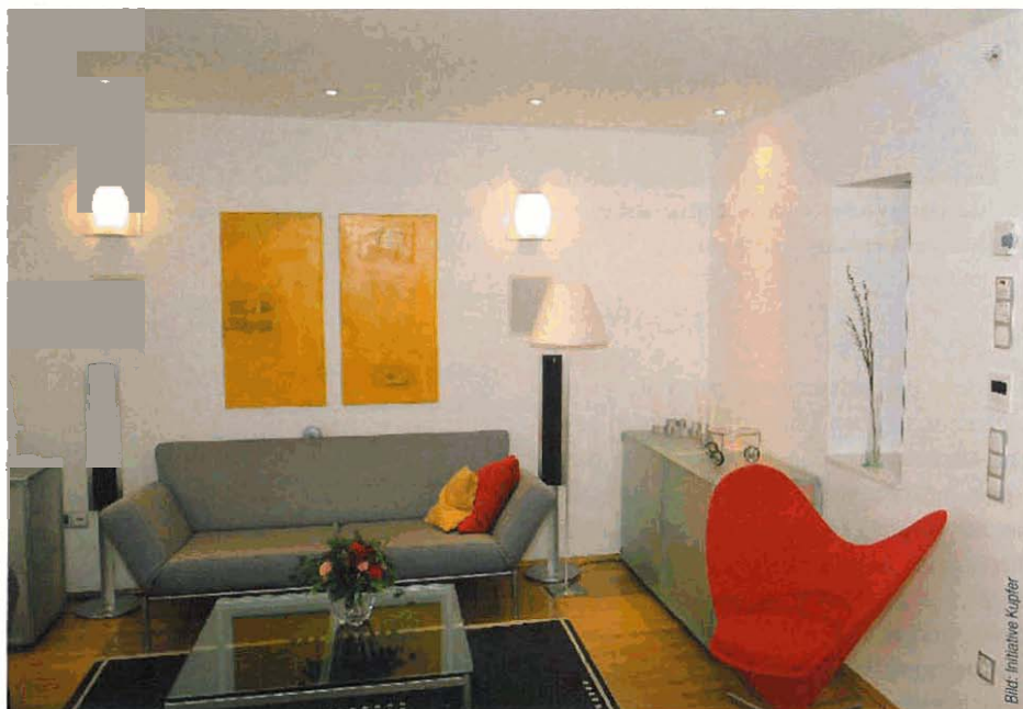
Sprinkler im Wohnbereich. Die für Bauherren und Entscheider wichtigste Botschaft: Sie nutzen nur und stören nicht. So genannte „Undercover-Sprinkler“ für den versenkten Einbau mit Abdeckrosette können die Sprinkler sogar gänzlich unsichtbar machen. Für die Musteranlage im inHaus1 wäre das aber wenig dienlich gewesen. Schließlich soll ja für die Lebensretter (im Bild oberhalb der Lichtschalter) geworben werden.

Sprinkleranlagen gehören in vielen öffentlichen Gebäuden zum Standard. Anders als in den USA und einigen europäischen Staaten werden sie in Deutschland in privaten Haushalten gar nicht und in Alten- und Pflegeeinrichtungen nur höchst selten installiert. Das könnte sich bald ändern, denn an fehlender Technik liegt es nicht, wie die funktionstüchtige Modellanlage in einem freistehenden Doppelhaus belegt.