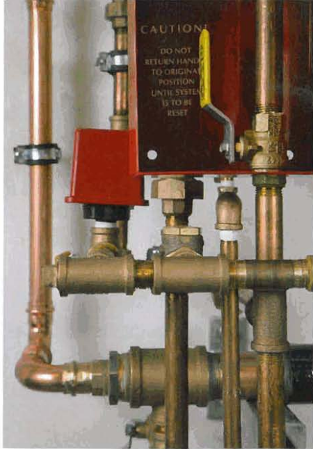
Die vorgesteuerte Versuchsanlage im inHaus1. Anstelle der kompliziert wirkenden Sonderanfertigung werden in Zukunft Komplettseinheiten zum Einsatz kommen.