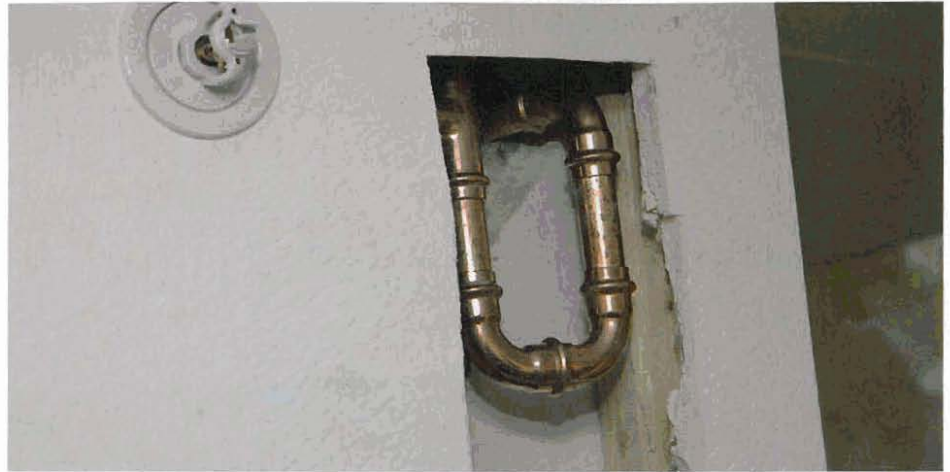
Obgleich die Sprinkleranlage im inHaus1 nachgerüstet wurde, war der Aufwand überschaubar. Besonders vorteilhaft waren die Verwendung von Kupferrohr und das Verpressen der Leitungsanlage.

Zukunft auch Privathaushalte mit Sprinklern auszustatten: „In den USA sind häusliche Sprinkler inzwischen Standard. Umso naheliegender ist der Gedanke, diesen lebensrettenden Brandschutz auch in Deutschland zum Einsatz zu bringen.“